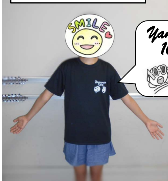
身長 158cm SS サイズを着用