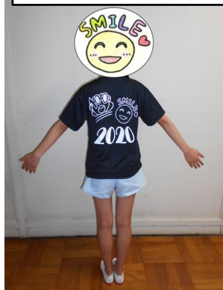
身長 158cm SS サイズを着用