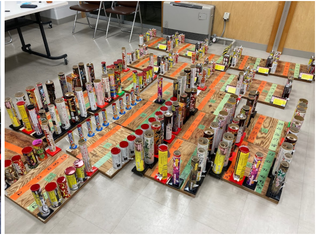
夏祭り: 打ち上げ花火