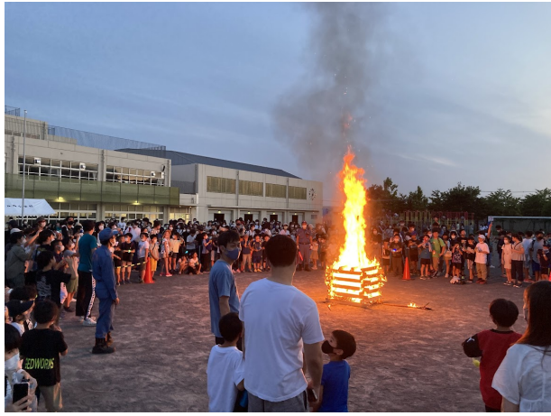
春祭り: キャンプファイヤー