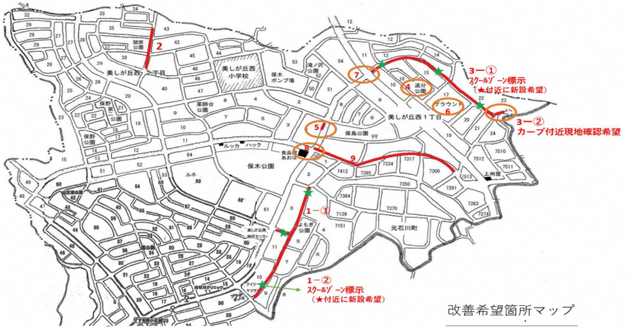
改善希望箇所マップ