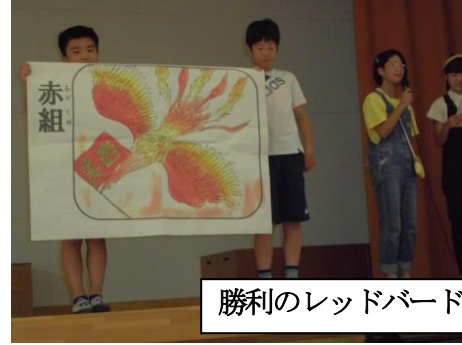
勝利のレッドバード