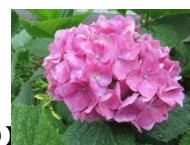
【雨の中咲くアジサイの花（校舎裏）】