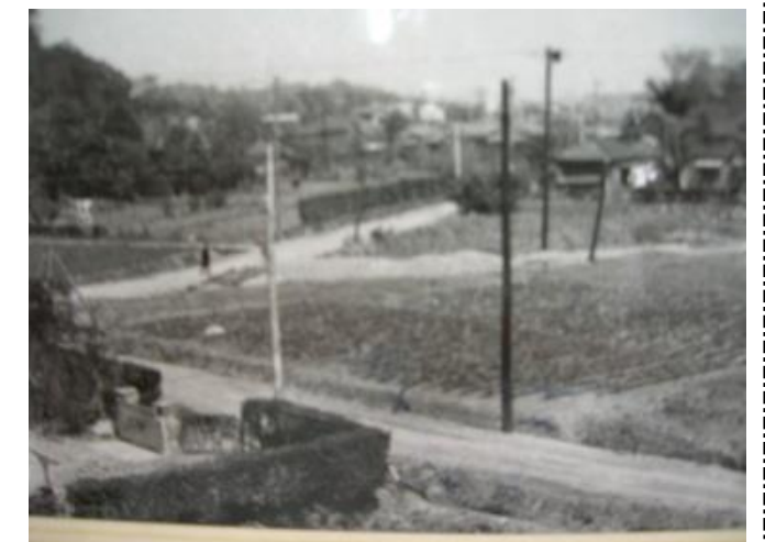
昭和35年頃の綱島東1丁目付近の風景

このまちはこれから大きく変わろうとしています。新駅の工事は進んでいて、トンネルを掘る準備に取り掛かっているそうですし、旧松下通信の跡地には、世界的な企業の研究所ができ、ショッピングセンターやマンションができる予定です。まちなぎは変わっていきますが、地域の人たちの思いは変わらないことでしょう。