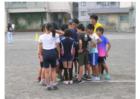
タブレットで自分たちのフォームを確認

ぜひ、学校の教育・指導にも関心をもっていただき、子どもたちが今どんな学習をしているかなどの話を聞いて欲しいと思います。