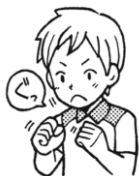
かみしめて 力の調節をする