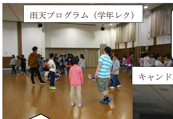
雨天プログラム（学年レク）

さ い こ さ い こ き い ろ う い っ う よ 高 ろ か 初 し 学 う な う い っ ょ 年 力 体 学 なく 初 う と し 験 び 合 か け し よ で 合 お ら ん て う お う 最 め う 後 い ま