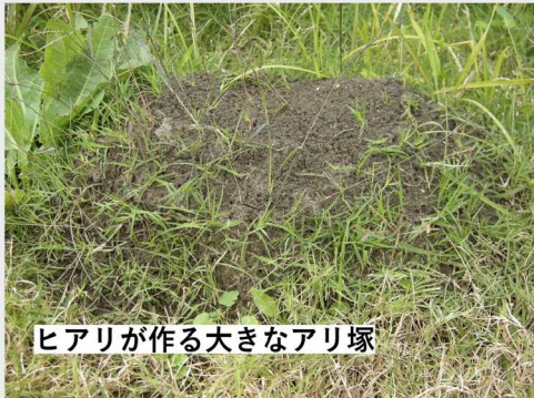
ヒアリが作る大きなアリ塚