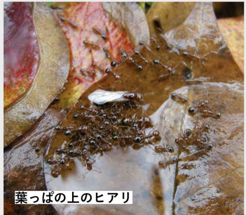
葉っぱの上のヒアリ