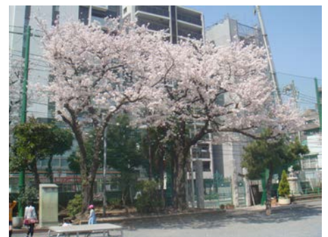
【春休み中、満開になった校庭の桜】