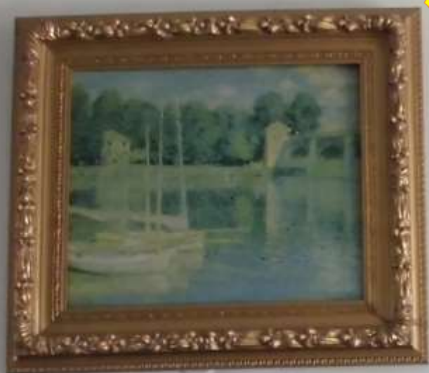
作 モネ (フランス 1841-1926) 題名 アルジェントイユの橋