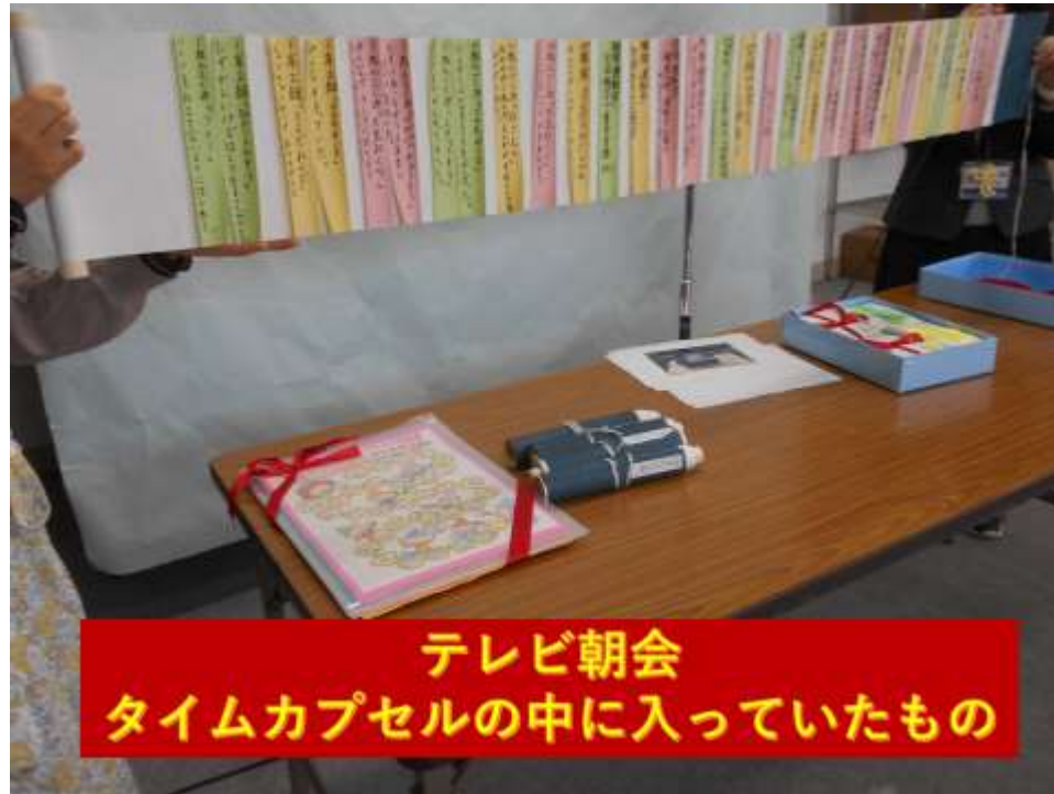
テレビ朝会 タイムカプセルの中に入っていたもの