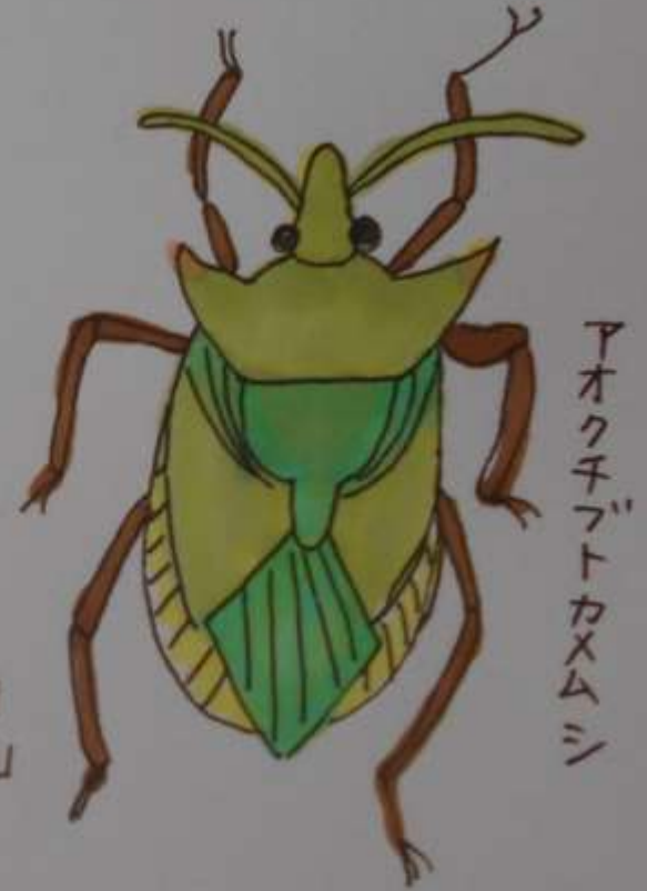
アオクチブトカメムシ