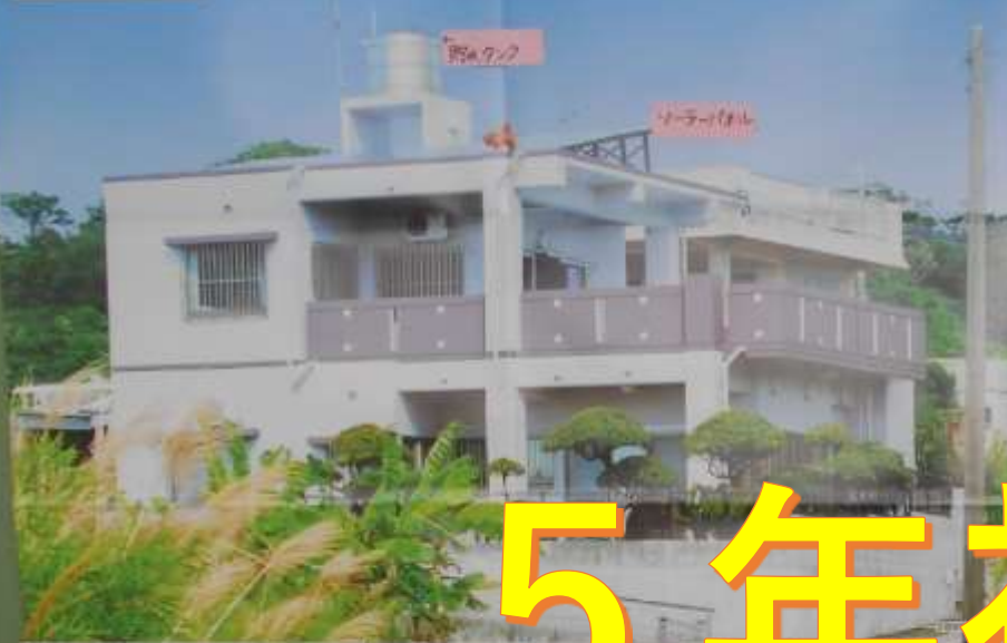
建設現場 5. 完成予定 【長野】沖積扇の家のづくり