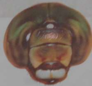
ルリボシヤンマ (あず)