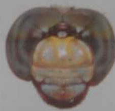
シオカラトンボ (あず)