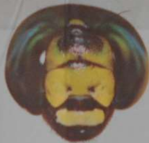
ルリボシヤンマ (あず)