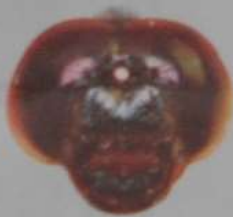
オオシオカラトンボ (あず)