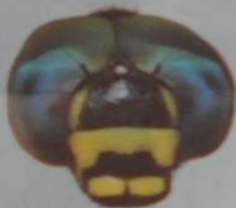
ミルンヤンマ (あず)