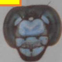
シオカラトンボ (あず)