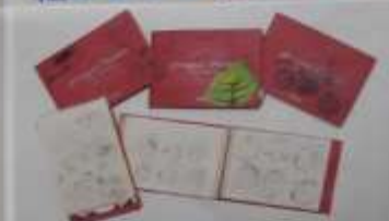
いつも持ち歩いているというスケッチブックにはまだずいぶん