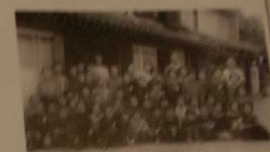
◎◎疎開先の旅館の前にもまった子どもたち。会津町(東京都)から鎌倉市(神奈川県)に疎開していた子どもたちです。