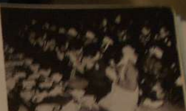
◎◎疎開先でもかきたまごの食事

つらいこともたくさんあったし、さびしい思いもしました。早く家に帰りたいけれど、そのことで泣いたことは一度もありませんでした。みんな同じ気持ちだということがわかっていたから、たえることができたのだと思います。