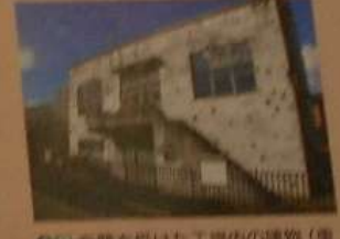
◎◎空襲を受けた工場内の建物(東京都東大和市) この航空機工場では、1945年の空襲で100名をこえる人々がなくなりました。この建物は、工場へ電気を送っていた変電所です。爆撃のすごさを伝える遺跡として、現在も残っています。