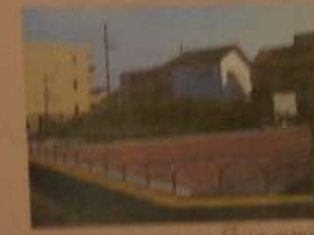
◎◎航空機をかくした壕(東京都府中市) 空襲では、重要な軍事基地がある場所も知らわれました。軍の飛行場があった府中市には、空襲で破壊されないように航空機をかくした壕(後身体)が残っており、市の指定されています。