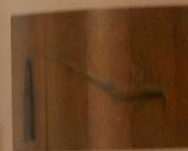
◎◎東京で最初の空襲被害(東京都目黒区) 1942年4月18日、東京は初めての空襲を受け、永元国民学校校の空襲が、焼夷弾を受けなくなりました。第8区博物館には、このときの弾と弾のあとが残る校舎の一部が保存されています。