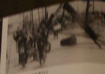
戦時 朝日赤十字の赤十字車で行く 予備校の校舎(神奈川県横浜市)