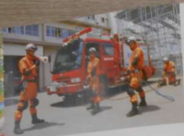
Q12 消防の仕事の現場の様子