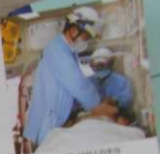
Q16 救急隊の中で、けが人の手当てをする消防隊員の様子

119番の知らせを受けると、救急車で駆けつけて、先病人やけが人を病院へ運ぶ仕事をしています。病院に着くまでの間、医師と連携して治療しながら、病人やけが人の手当てをします。 人の命にかかわる仕事なので、いつも気を引きしめて働いていますが、やりがいのある仕事です。