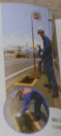
Q13 消防の仕事の様子