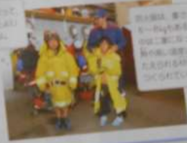
Q15 消防の仕事の様子

消防署では、事故が起きたときに、消防士が、事故現場に駆けつけ、事故の原因を調査し、たまたまの事故を防ぐために、消防士が、事故現場に駆けつけ、事故の原因を調査し、たまたまの事故を防ぐために、