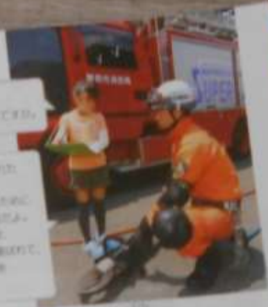
Q14 消防の仕事の様子

事故で怪けのひびいた自動車から、勝手に入庫されるために、消防署がきつて消防隊員が、物が出された人は、すぐに消防署へ連絡して、消防隊員の手助けを受けるんだ。