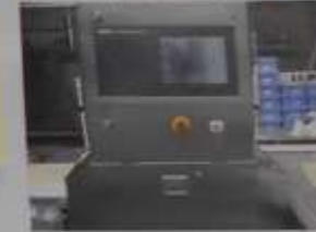
Q しゅうまいをけんごりする機械