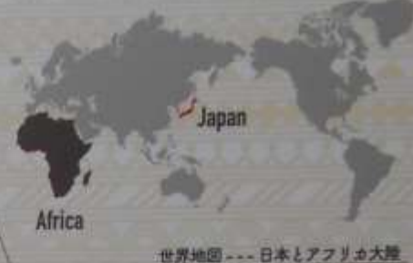
世界地図 --- 日本とアフリカ大陸

サハラ砂漠 アフリカ大陸の大半を占める巨大な砂漠です。 大きなアカシアの木は、アフリカの人々に重要な役割を果たしています。