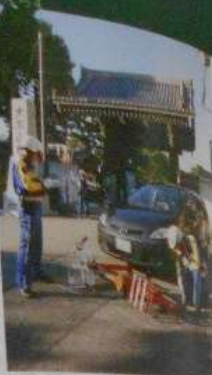
○交通事故の現場で働く警察官