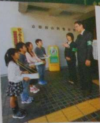
○臨 警察署への訪問