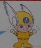
神奈川県警察のマスコット ピーガルくん