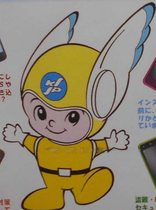
神奈川県警察のマスコット ピーガルくん