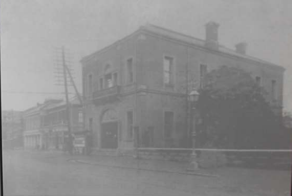
明治22年当時の市役所（横浜開港資料館蔵）