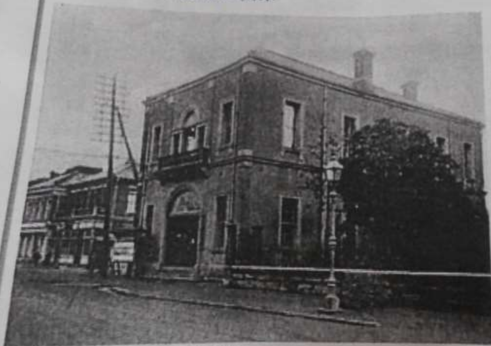
（明治22年当時の市役所）

明治22（1889）年に、全国の市で初めての議会が開かれた時、すべての市が「市会」という呼び方を使っていました。