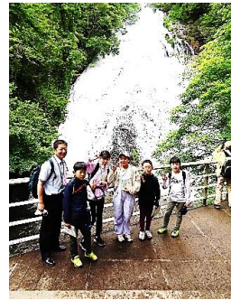
湯滝・湯ノ湖ハイキング

一日目は自然をメインに湯滝や湯ノ湖ハイキング、華厳の滝に行きました。二日目は歴史をメインに輪王寺三仏堂や日光東照宮、大猷院を訪れました。天候が心配されましたが、1年生にプレゼントしてもらったお守りやてるてる坊主のおかげでしょうか、雨に降られることなくすべての行程を予定通りに進めることができました。グループ活動では、班長を中心にルールやマナーを守って行動する姿が見られました。よい思い出をつくることができ、子どもたちの笑顔が印象的でした。