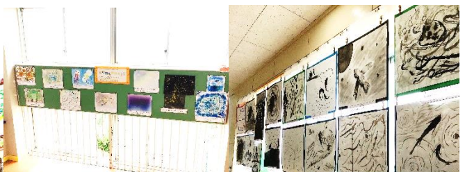
教室前や廊下、階段踊り場には、子ども達の作品がたくさん掲示されています。