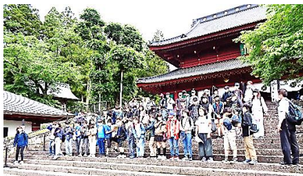
輪王寺の前で学年写真