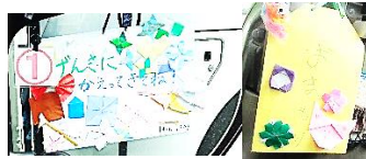
1年生からのお守り