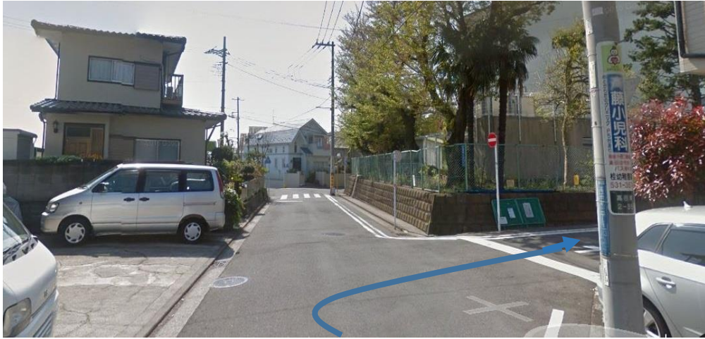
⑤ さらに進むと右手に校舎が見えてきます。ここを右に曲がります。