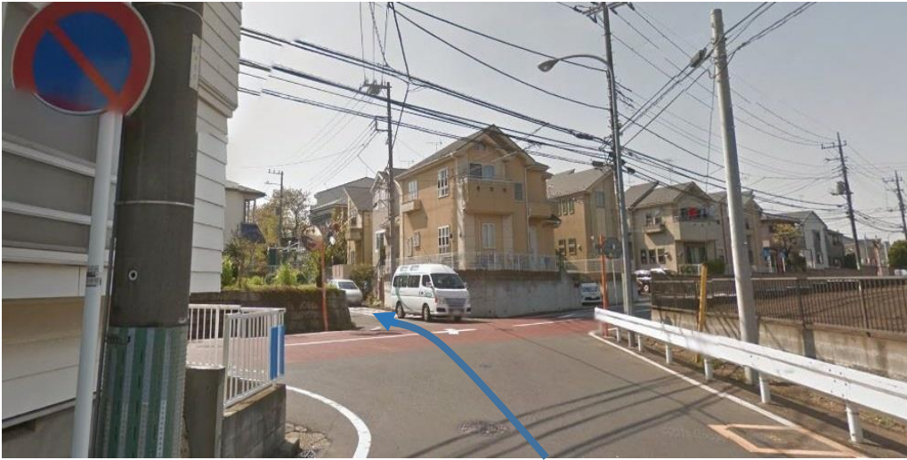
④ 十字路が見えてきますが、真っ直ぐに進みます。