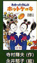
寺村輝夫 (作) 永井郁子 (絵)

表紙が好き、パラパラめくってみておもしろ う、など興味を持ってそうな本があったら開いて みる。読みやすい本からスタートして、読む習慣を身につけることが大事です。