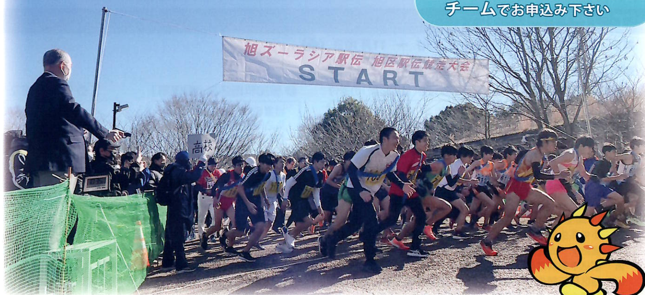
旭区マスコットキャラクター あさひくん