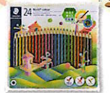
[ステッドラー日本株式会社] ノリカラー色鉛筆 メタルケース入り 24色セット ×10名