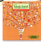
[東急ハンズ] カタログギフト [from hand to hand] ×4名