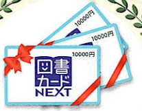
図書カード 3万円分×1名