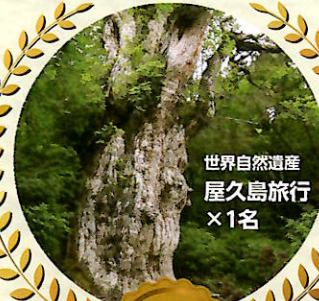
世界自然遺産 屋久島旅行 ×1名