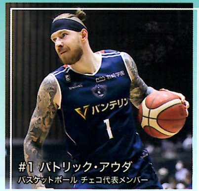
#1 パトリック・アウダ バスケットボール チェコ代表メンバー