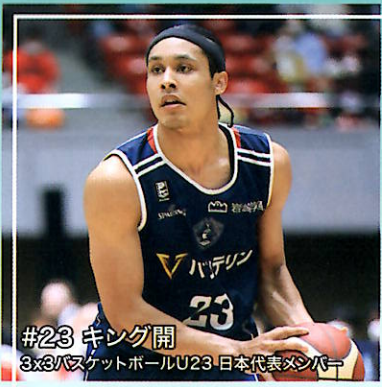
#23 キング開 3x3バスケットボールU23 日本代表メンバー