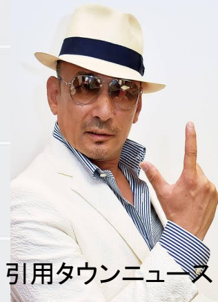
引用タウンニュース