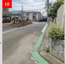
10 道幅が狭く、車や自転車の往来が多いため注意してください。