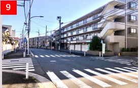
9 信号が無いため、横断の際には注意してください。登下校時、ケヤキ通りの横断は禁止です。