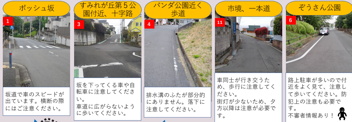
1 ポッシュ坂 坂道で車のスピードが出ています。横断の際にはご注意ください。