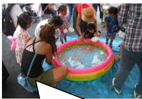
職員ブースは、おなじみ「スーパーボールすくい」