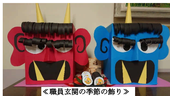
《職員玄関の季節の飾り》

もうすぐ立春。暦の上では春を迎えますが、まだまだ厳しい寒さが続いています。学校の杉田梅は、寒さに耐えながらも、つぼみを赤く染めて、春の訪れを待っているようです。皆様には日頃より本校の教育活動にご理解とご協力をいただき、心よりお礼申し上げます。