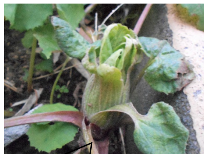
校内のフキノトウ。 もう、葉が大きく開いています。

そして、四月にはすべての子どもたちに新たな出会いがまっています。「一期一会」の心構えで、四月を迎えてほしいと思います。