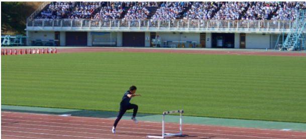
ハードル日本代表 金井大旺 選手

11月7日(木)、第69回横浜市立小学校体育大会が、今年度も三ツ沢競技場で行われました。横浜市内の4区の6年生が集いました。演技『Let's Dance With YOKOHAMA』では、3000人以上の子どもたちが心を一つにして踊る姿に喝采が起こりました。「4×100m走」「100m走」、そして「タイムトライアル7(7秒間走)」では、走りきる楽しさや喜びを感じることができました。また、長縄跳びに全力で取り組んだり、世界陸上ドーハ大会の代表選手である金井大旺さんのお話を聞いたりして、スポーツへの関心が高まる経験ができました。