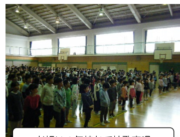
お祝いの気持ちで校歌斉唱