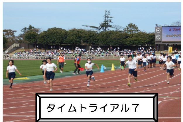
タイムトライアル7