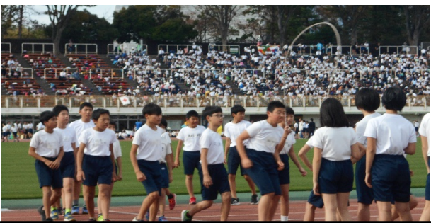
めざせクラスの最高記録 長縄跳び