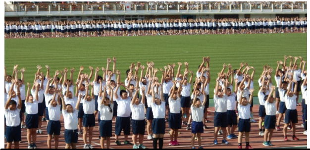
Let's Dance With YOKOHAMA