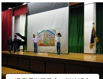
児童運営委員会の学校紹介

「我らが学校、末吉小学校」これまでの歩みを知るとともに、これからも末吉小学校を大切にしていってほしいと思います。