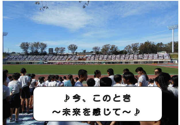
♪今、このとき ～未来を感じて～♪