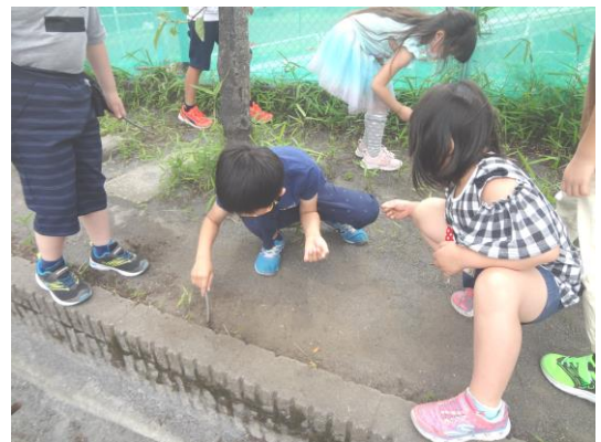
休み時間は 虫探しに夢中

きっと未来の年表にも記されることになるだろうコロナ禍での生活は、今しばらく続きそうですが、一人ひとりの子どもの思いや考えを大切にしながら、乗り切っていきたいと思います。