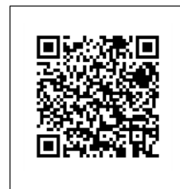
やさしい日本語版