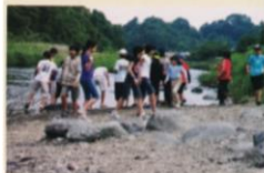
自然の雄大さを味わい 地域の産業にふれた 愛川体験学習(5年)