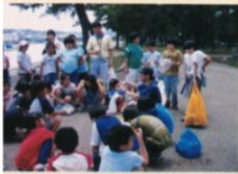
自然を楽しんだ 野島体験学習(4年)