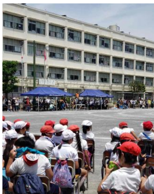
運動会での会長挨拶

これまで50年以上PTA活動を続けてこれたのは、子どもたちのために保護者・学校・地域が一体となった日々の積み重ねがあったからこそです。メンバー一同、この温かい繋がりを次に引き継いでいけるよう、工夫しながらPTA活動を進めていきます。