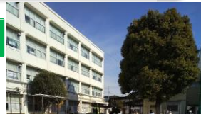
50周年シンボルのくすのき