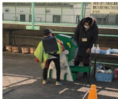
ガラポンイベントの様子