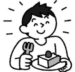
ときには自分にご褒美

これをしている時間が好き！ これをすれば必ずリラックスできるなにかをみつけておこう！