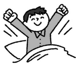
ぐっすり十分な睡眠