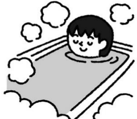
ぬるめの湯船につかる