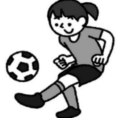
趣味の時間を大切に