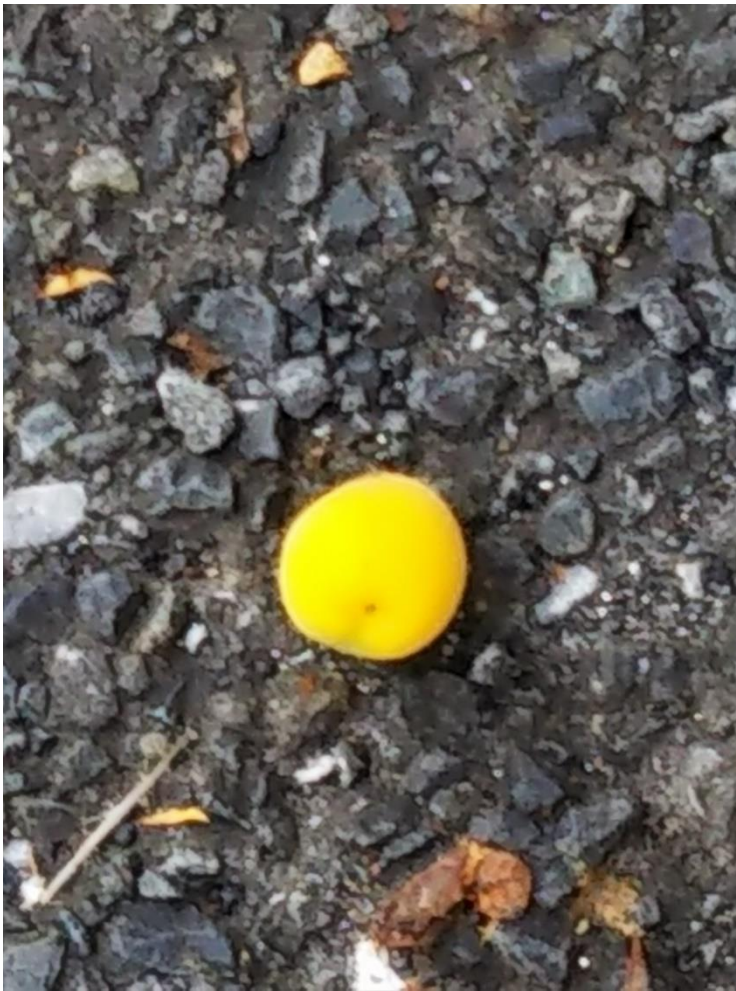
これは梅の実です。