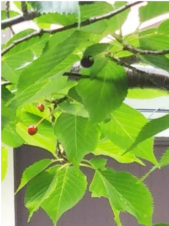
これは桜の木についている実です。