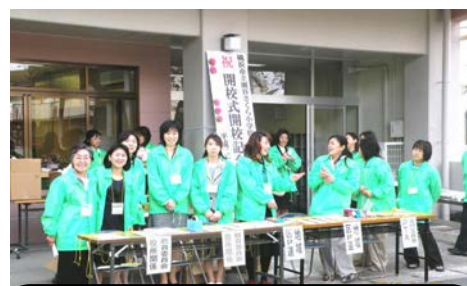
開校式受付 両校の保護者、地域の皆さんがすでに和気藹々で仕事をしてくださいました。