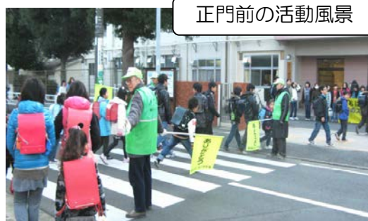
正門前の活動風景

この放課後の補習は短期間の試みでしたが、成功裏にスタートできたこと、そして他校では地域住民が中心となり、定期的に行なって成功していることから、本校でも出来ない事では無いはずだと考えています。課題を整理して、子どもたちの学力向上のために、支援の方法を考えていきます。