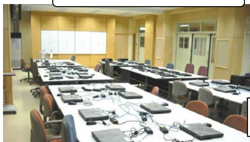
学習センター（PC教室）