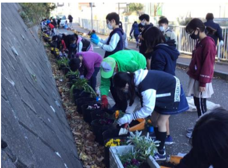
相沢川沿いの新通学路での花の植付