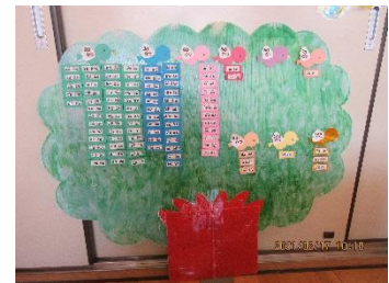
50冊以上を達成した児童名