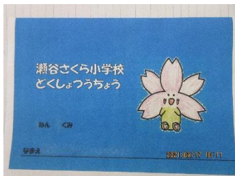
「どくしょつうちょう」の表紙