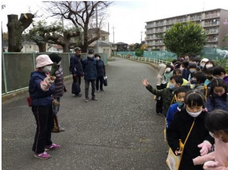
下瀬谷団地の花壇の見学

下瀬谷団地の花壇の見学と球根の植付をしました 団地の隊員が4日間質問に答えたり球根の植付・草取り体験を手伝いました