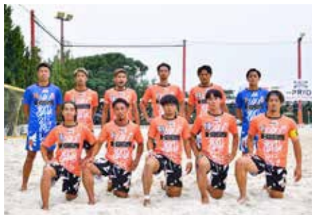
男子ビーチサッカーチーム