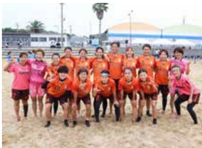
女子ビーチサッカーチーム