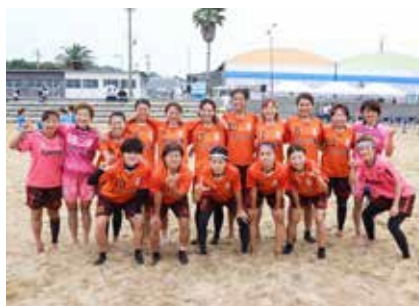
女子ビーチサッカーチーム