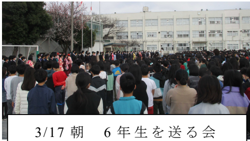
3/17 朝 6年生を送る会

門出の日に合わせてかのようにほころび始めた校庭のソメイヨシノが、早くも見ごろを迎えようとしています。