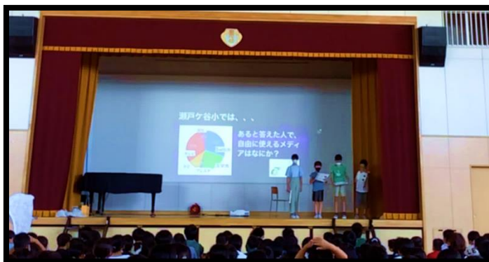
健康委員会の発表 ↑

また、当日は、多くの保護者の方にも参加していただきました。保護者同士でお子さんの様子や 家での約束事について話し合っただく機会になりました。会の途中には、保護者目線でのご意 見をいただき、子どもたちにとってとても意味のあるお話で心に響いたことと思います。お忙しい 中、そしてとても暑い中、ご参加、ご指導いただき、ありがとうございました。引き続き、ご家庭 でもご指導をよろしくお願いいたします。