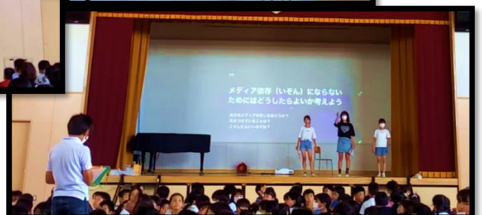
話し合ったことを全体で発表する6年生 →