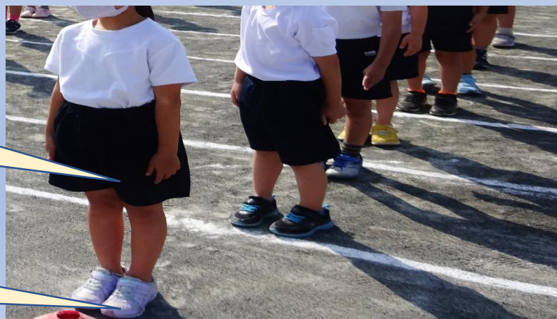
【通学靴（運動靴）】 体育でも使用する、 活動しやすい靴を履きます