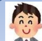
※印は学校支給 及び一括購入品 になります。