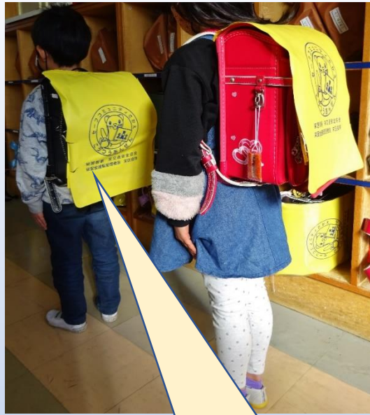
【安全ブザー※】 ランドセルに装着します