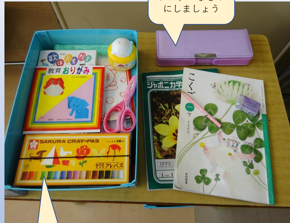
【筆箱】 気が散らない シンプルなもの にしましょう