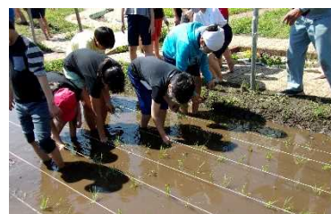
田植えで ずぼずぼ めるめる

本校では、「三耕教育」を中心に長年教育活動を展開してきました。そして、国語科を中心に研究を始めて2年目となります。日本語は、世界でも習得が難しい言語と言われていますが、指導をしている職員も研修をしっかりと行い、新しい学習観に則った学習展開ができるように努めています。ところで、日本語のどんなところが難しいとされるのでしょうか。まずは、文字の多さです。ひらが